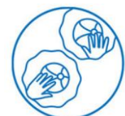
bubbel apart spelen